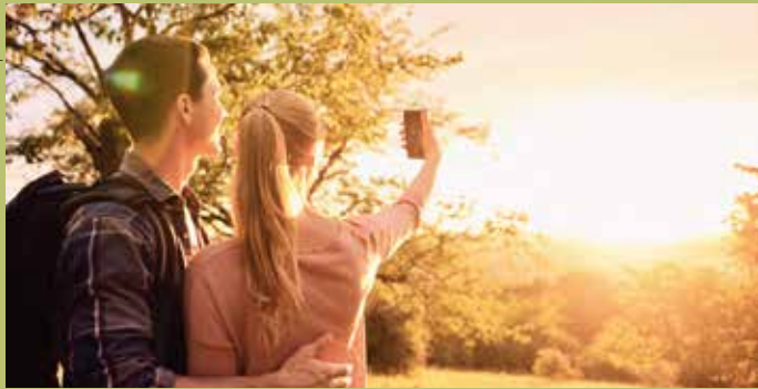
Erinnerungen die bleiben und die man gerne teilt.

Dank nur geringer Steigung und auf Gras- oder Schotterwegen gut begehbar, ermöglicht die kurze Tour zu jeder Jahreszeit Naturgenuss fast ohne Anstrengung. Ständig begleitet von wunderbaren Ausblicken ins Steinlachtal und weit darüber hinaus,